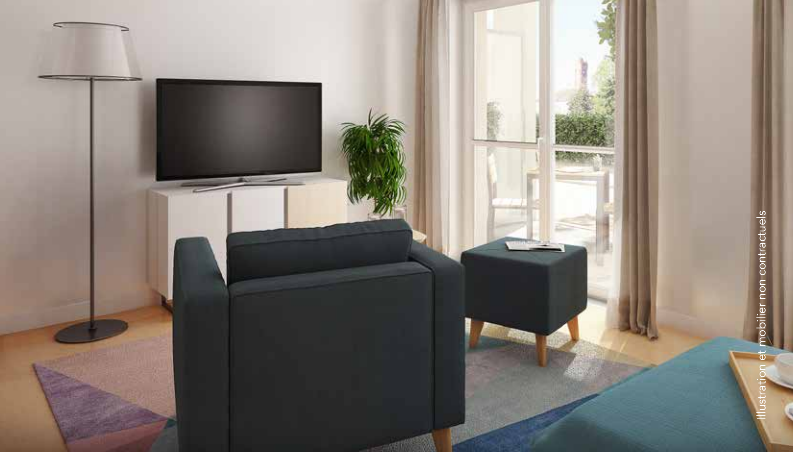
Illustration et mobilier non contractuels